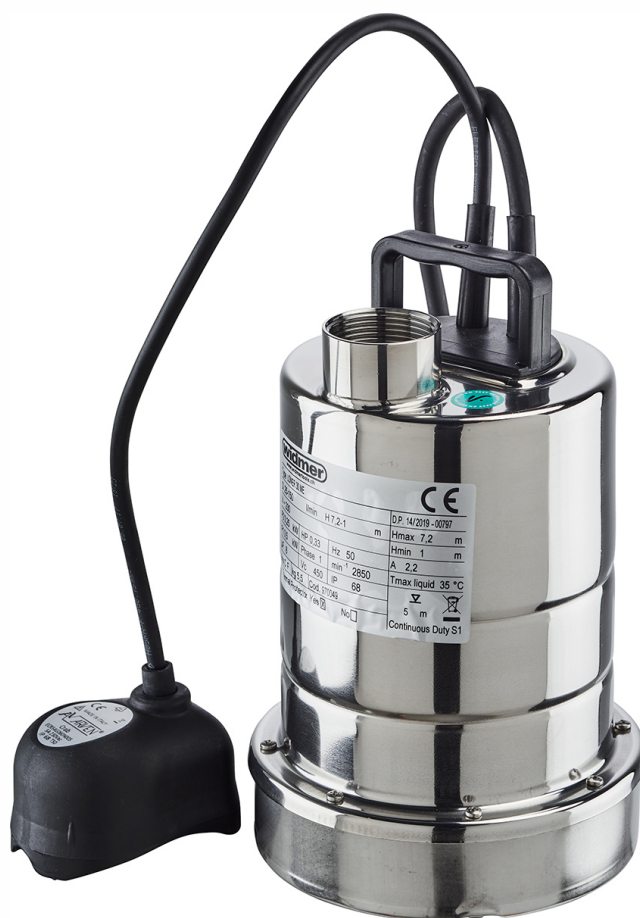
LOWER 30 ME

ⓕ Pompe submersible - Pompe de plongée 1-2 mm