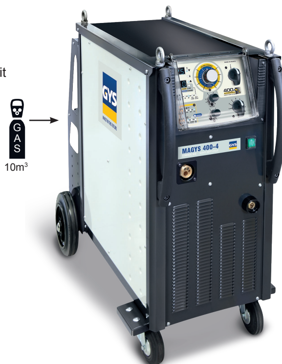
Originalanlage ohne Zubehör Art.-Nr. 032170