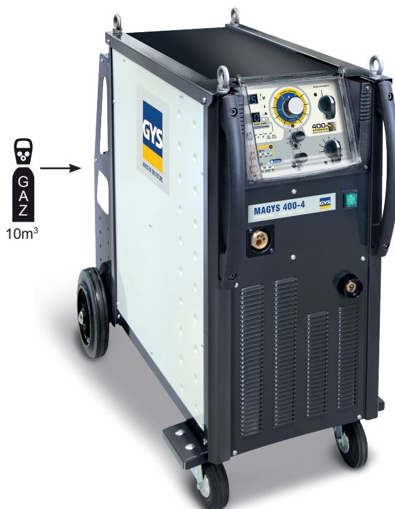
Poste fourni sans accessoires ref. 032170