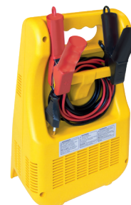
Logement pour rangement des câbles et pinces.