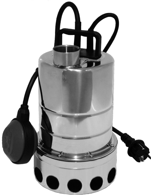
Inox 500 - Inox 700

F Pompe submersible - Pompe de plongée 1-2 mm