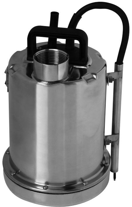
FS 41 Inox - Inox 500 E

Bedienungsanleitung Instructions d'emploi