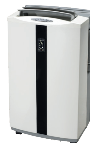
Energieklasse A Classe d'énergie A