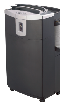
Energieklasse A Classe d'énergie A